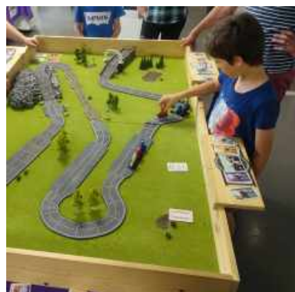
Tournoi Flamme Rouge