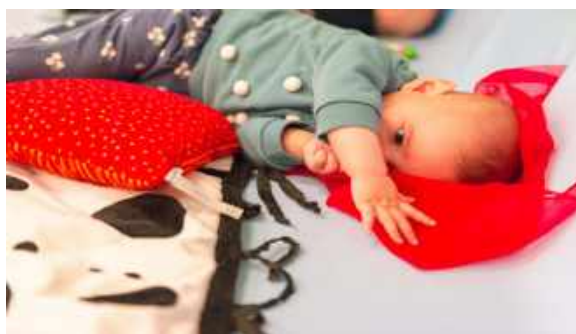
Semaine de la motricité libre