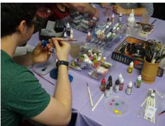
Découverte Figurines (peinture)

Conformément au projet, une Soirée Familles sur le thème des monstres, « Monstrueuse soirée au CLuBB », a aussi été organisée en novembre 2019. Première de trois dates réparties sur la saison, cette animation prend place dans le cadre d'une réflexion sur la fidélisation du public famille.