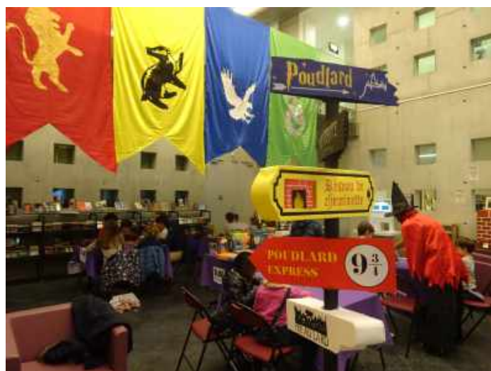
Après-midi jeux dans l'Atrium, dans le cadre de la quinzaine « Bienvenue à Poudlard »

Jouer est un acte fondateur de l'individu et le jeu mérite d'être reconnu en tant qu'objet culturel, créateur de liens sociaux.